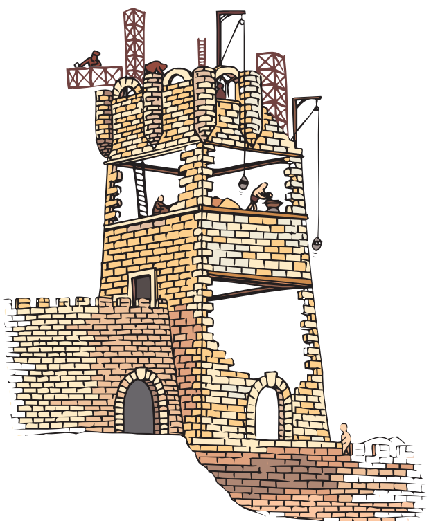
▲ Construcción de la torre central del castillo.