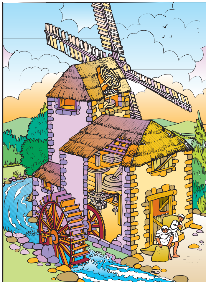
▲ Molino hidráulico. Sus dueños eran los señores y los monasterios. Los campesinos pagaban por usarlos.