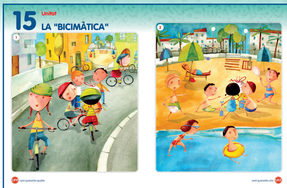
LÀMINA 1 (pàg. 144)